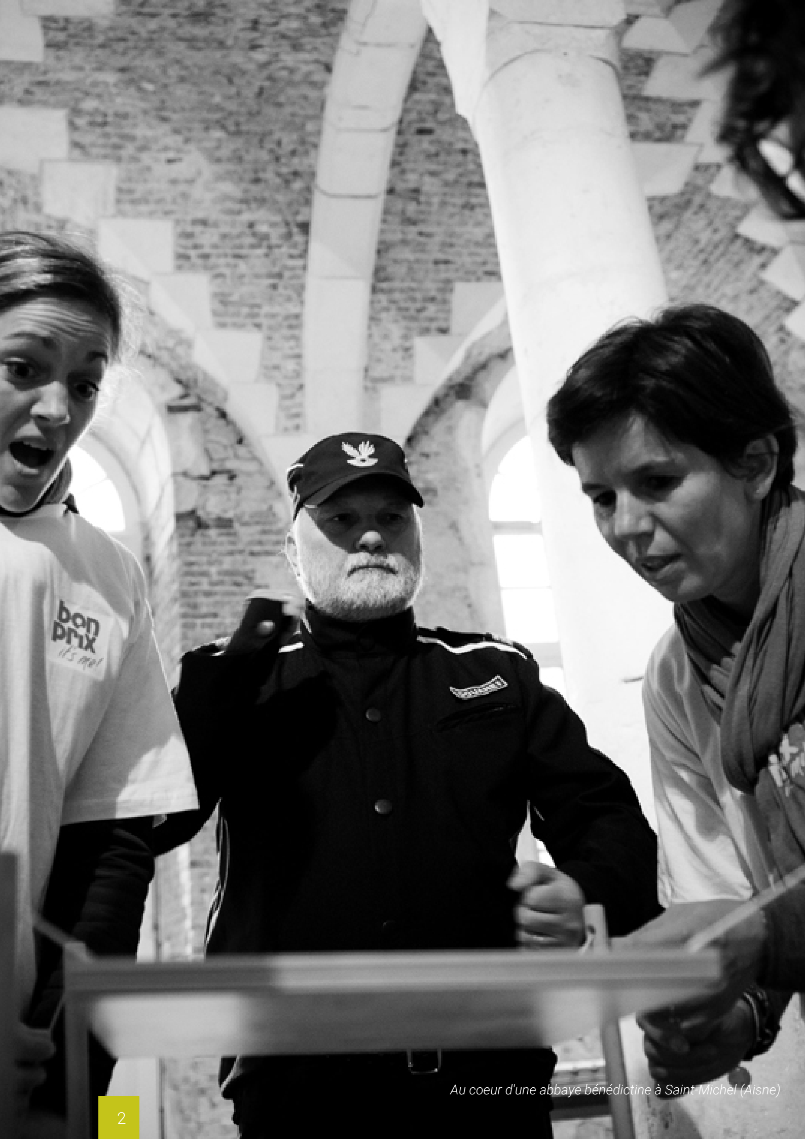
Au coeur d'une abbaye bénédictine à Saint-Michel (Aisne)