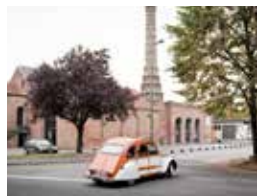
Rallye en 2CV