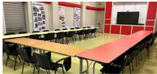
Salle de 100 m 2